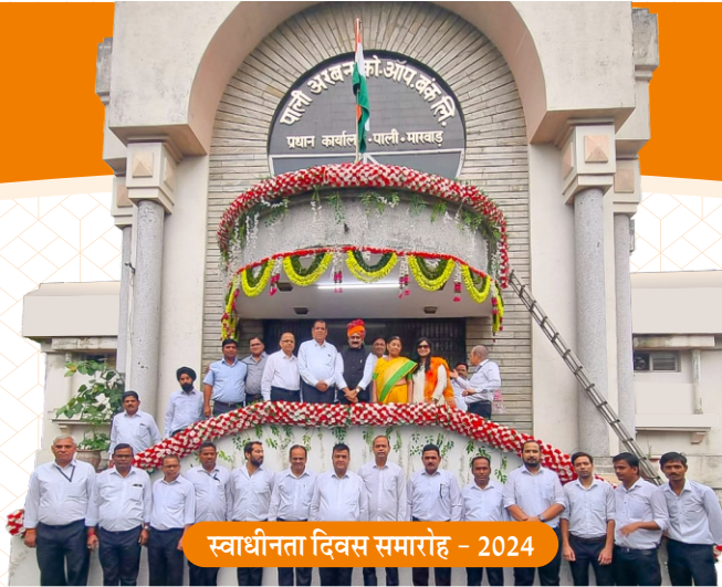
स्वाधीनता दिवस समारोह - 2024