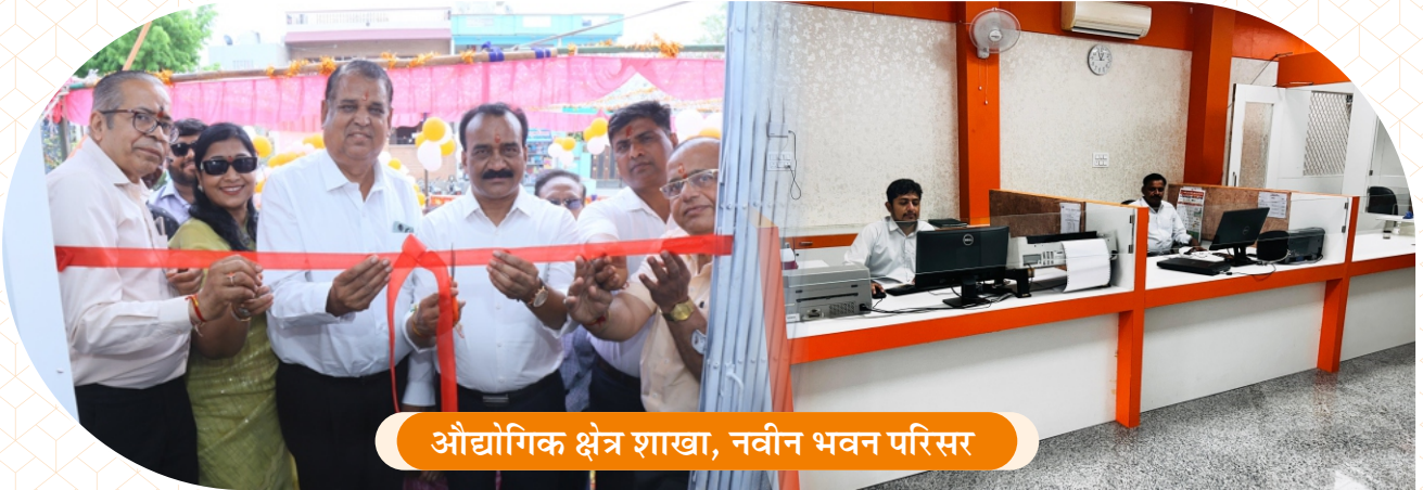
औद्योगिक क्षेत्र शाखा, नवीन भवन परिसर