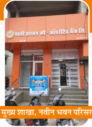
मुख्य शाखा, नवीन भवन परिसर