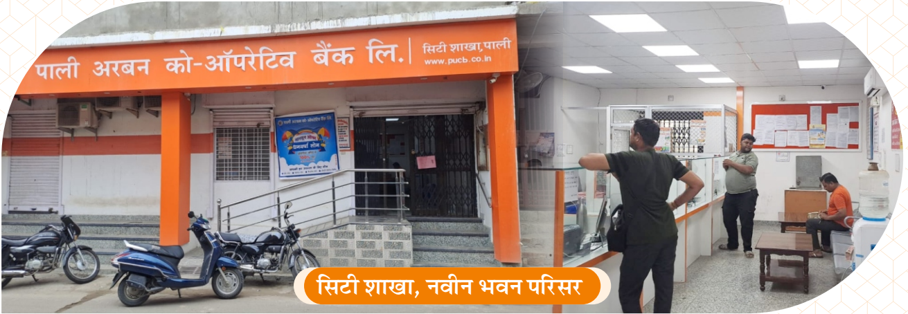
सिटी शाखा, नवीन भवन परिसर